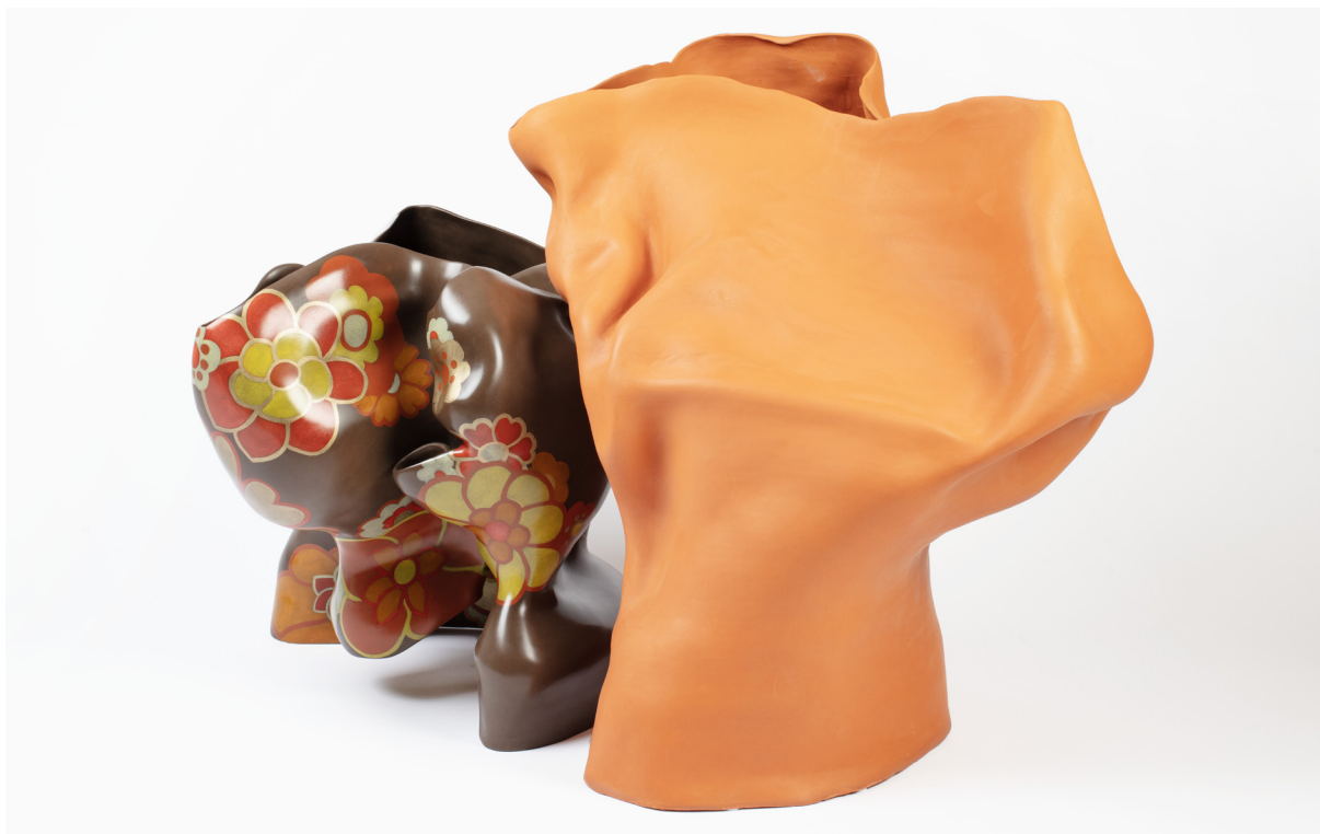
Pop and ocher, 2022 grés et crayon de couleur sous patine 64 x 68 x 68 / 85 x 80 x 76 cm

Temps mythologiques et emprunts à diverses civilisations de l'histoire humaine ont formé et marqué les sculptures en céramique de Farida Le Suavé. L'artiste appartient à son temps tout en le dépassant. Archaisme et contemporanéité sont étroitement enlacées dans ses œuvres riches, toute en suggestions à l'équilibre fragile. Il y a dans ses formes un écho humain indéniable ; elles sont langoureuses, désireuses, adroites et maladroites, tragiques, drôles, sensuelles et parfois en souffrance. Si les orifices peuvent introduire une ambiguïté par leur référence à l'objet-contenant, l'artiste s'en empare et la détourne en insufflant aux œuvres une respiration.