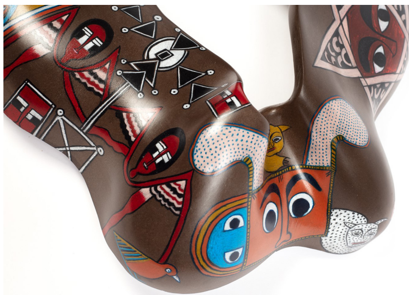
Grand tésson éthiopie (détail) 2022 grés et crayon de couleur sous patine 36 x 58 x 12 cm