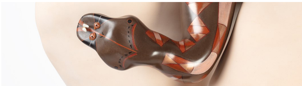
Sous-bois (détail), 2022 grés et crayon de couleur sous patine 180 x 82 x 73 cm

La couleur de la terre est celle de la peau – blanche, rouge, noire... leur texture est lisse, soyeuse telle un derme. Sur la surface de certaines pièces ondulent ornements, signes et symboles dessinés au crayon de couleur - tel des tatouages. On y lit paysages, rythmes et incantations. Les dessins, rébus et énigmes sur papier que crée Farida Le Suavé depuis l'enfance trouvent ici un terrain nouveau. Ils font peau avec ses œuvres en volume comme les peintures rupestres de nos ancêtres font corps avec les parois du monde sous-terrain qui les porte.